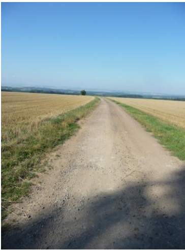
přijezd od Rozsochy