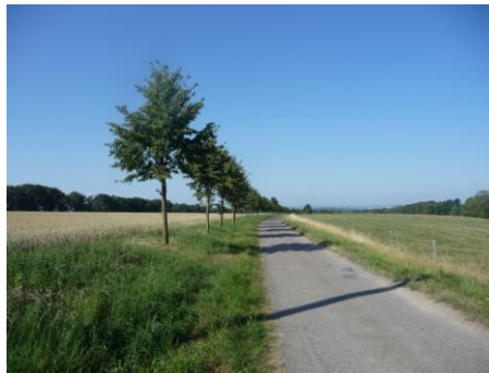
lipová alej k Brandýsu