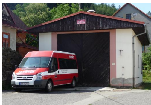
hasičská zbrojnice s novým autem