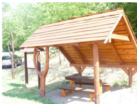
posezení u hřiště – stezka „Po stopách živé vody“