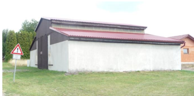
kůlna – technické zázemí obce