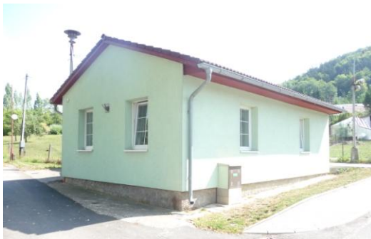
obecní dům - prádelka