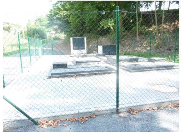
čistírna odpadních vod