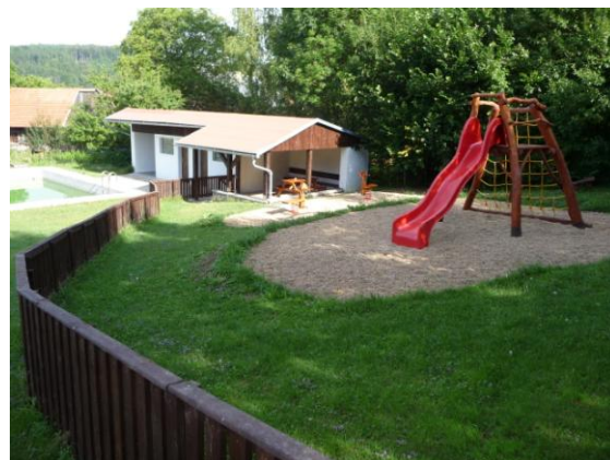
zázemí u koupaliště