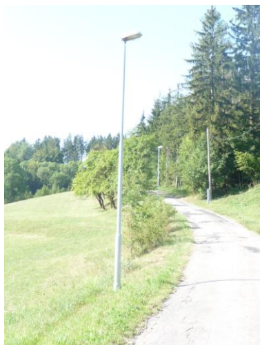
nové veřejné osvětlení