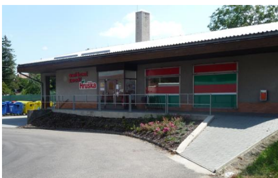
obchod se smíšeným zbožím