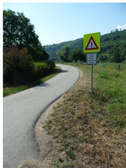
cyklostezka údolím Tiché Orlice