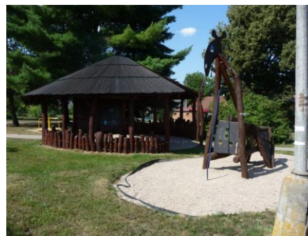
parčík s altánem a herními prvky