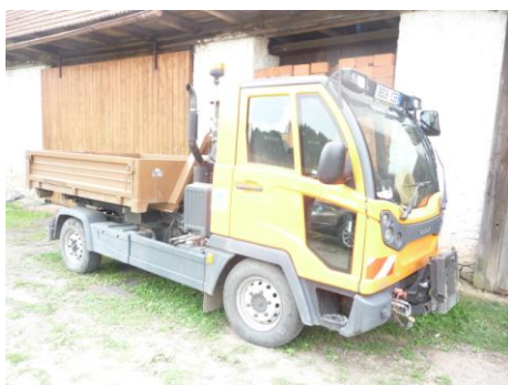
multikára M3 s příslušenstvím