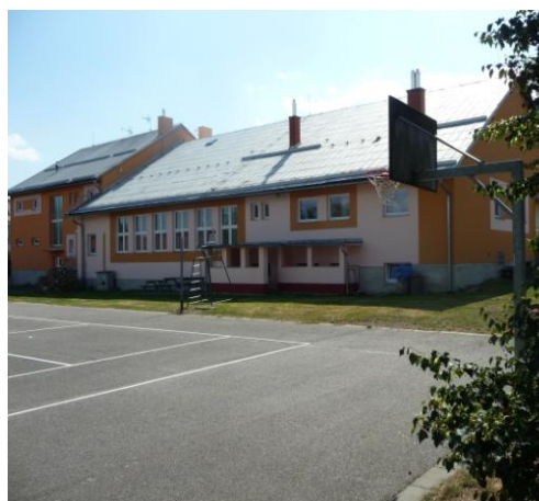
hřiště u kulturního domu