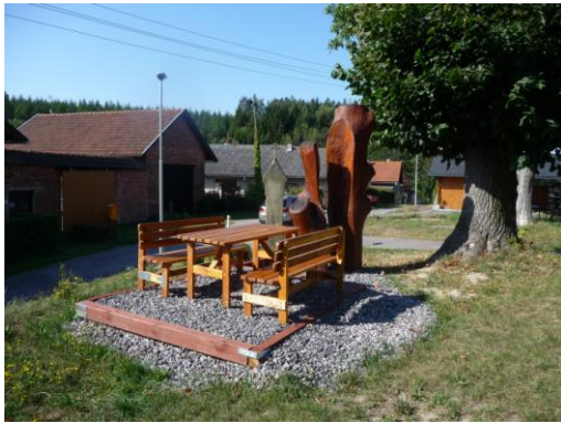
občané sami sobě