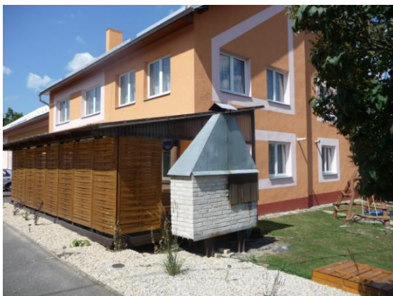
hospoda s posezením, kulturní dům