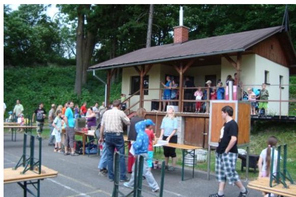
oslavy dětského dne