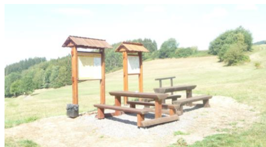
posezení u Němčáku