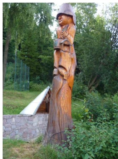
vodník pod Hůrkou