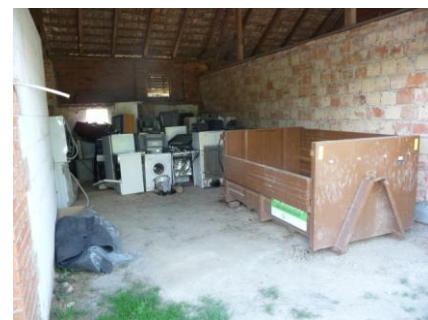
třídíme elektro a bioodpad