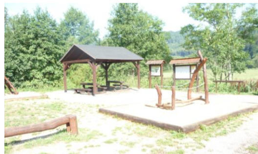
dětské hřiště u cyklostezky