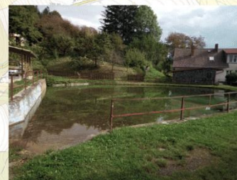
Dobrovodský pramen (13010)