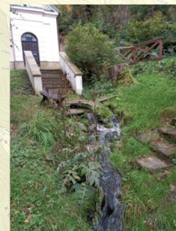
Studánka v Klopotech (6787)