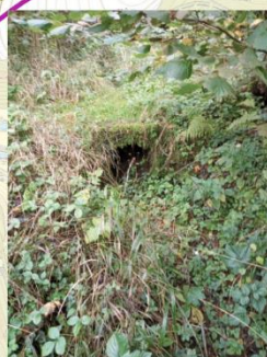
Studánka v Luhu (8465)