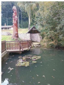
Studánka ve Rvišti (5252)