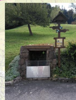
Jirouškův pramen (5251)