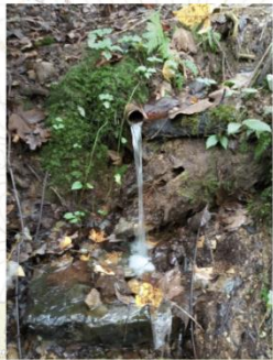
Studánka v Luhu (6802)