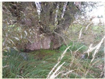
Pramen Dolenského potoka (8464)