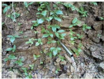
Rikitanova Studánka (7286)