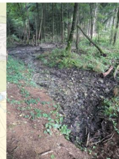
Pramen Pekelského p. II (10443)