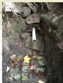
Studánka nad cestou (12204)