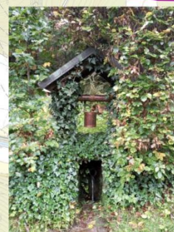
Studánka pod lesem (11576)