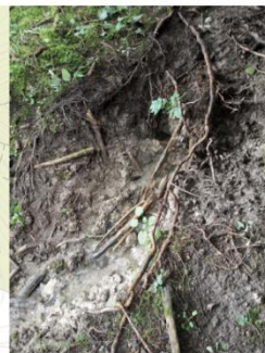
Pramen Pekelského p. I (10442)