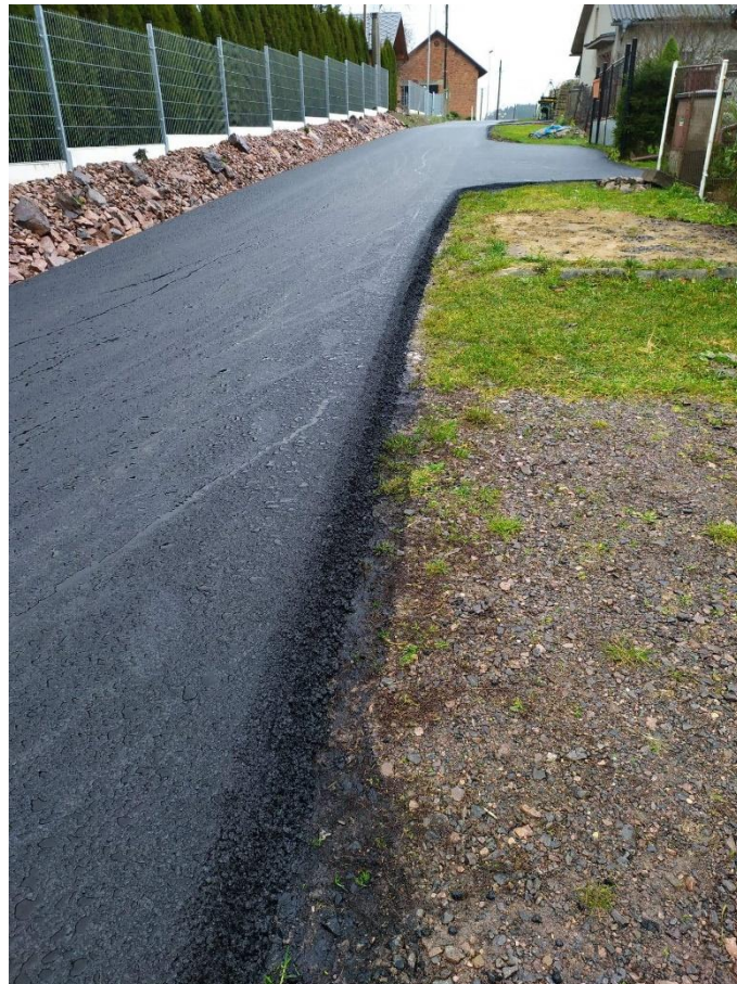
Nový povrch komunikace na Horní Rozsoše – před dosypáním krajnic.