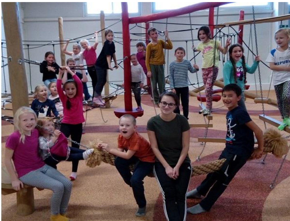
Skipi park Letohrad

Děti projevují o nabízené aktivitě velký zájem a nás těší, že je můžeme rozvíjet i těmito cestami.