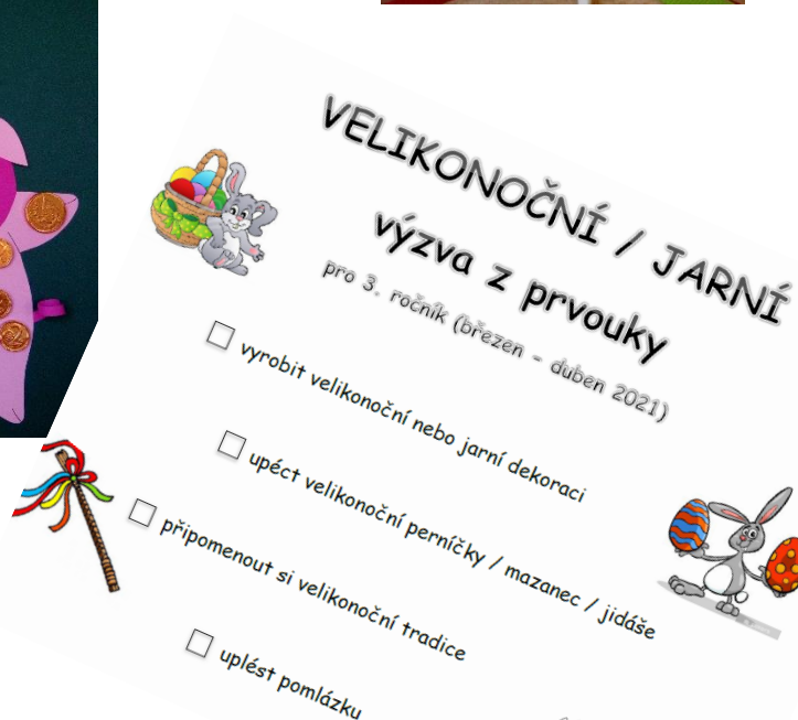
foto: zázemí k online výuce – P. Przywarová velikonoční tvoření - beránek březnová soutěž v čj velikonoční/jarní výzva